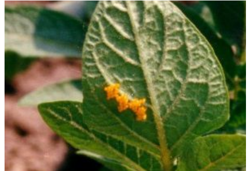
Œufs de doryphores

Chaque jour (sauf le dimanche), j'inspecte donc ainsi seulement 1/6ème de ma culture de pommes de terre. Mais chaque semaine (donc le temps d'éclosion) tous les plants sont donc scrutés de près.