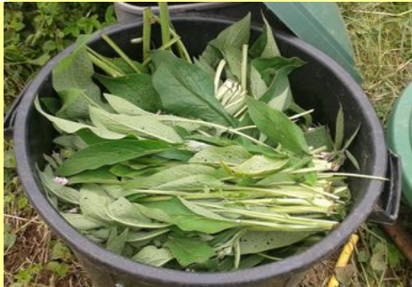
Poubelle remplie de consoude. Il ne reste plus qu'à ajouter de l'eau...