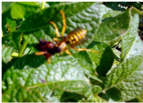
... elle ne lui laisse aucune chance !

Il est donc essentiel de favoriser la venue de ces auxiliaires, notamment en préservant des zones sauvages aux alentours et même au sein de votre potager.