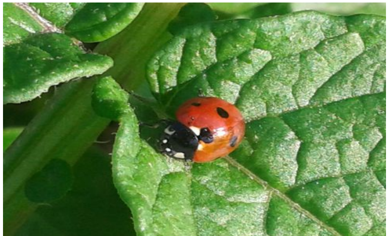
Cette sympathique coccinelle m'a indiqué la présence d'œufs de doryphores sur ce plant de pommes de terre