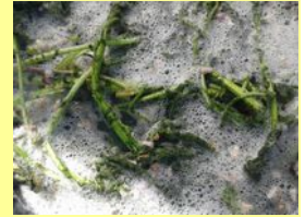
ça mousse ! Il faut encore attendre...