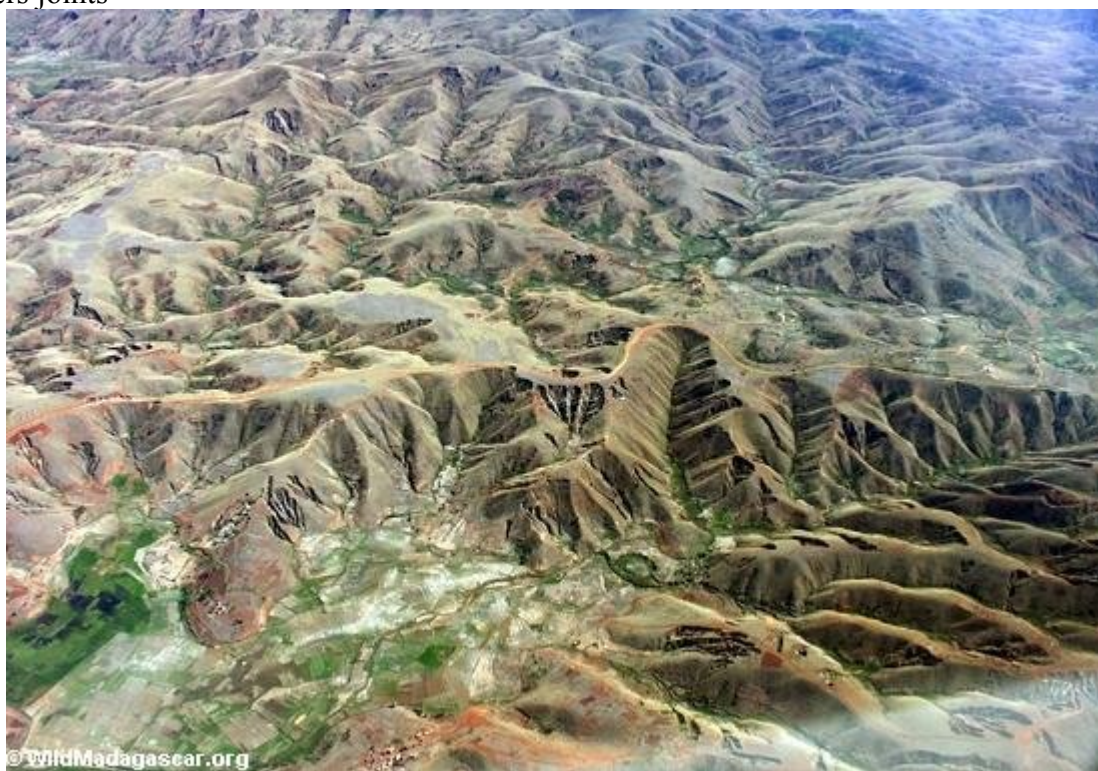
jadis la foret tropicale, apres la coupe la naissance d'un désert. madagascar_erosion_.jpg (85.1 Kio) Vu 333 fois